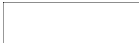
czytelny podpis Reprezentanta

* - przypadku wpisania w niniejsze pole daty wcześniejszej niż data wysłania wniosku, uzna się za datę zmiany danych datę wpływu pisma